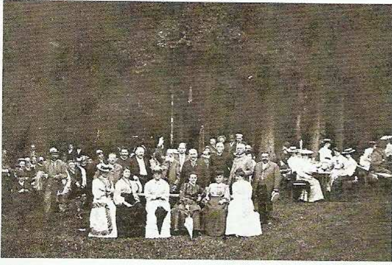
28. června 1905 se sešli přátelé turistiky české na kraji nově zřízené pohodlné silnice,