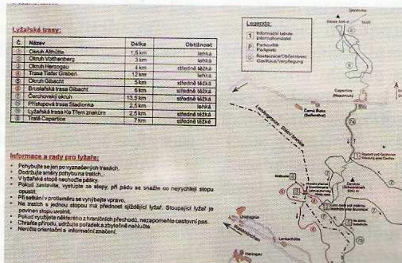
Cesta „Stadionka“ slouží už přes sto let.