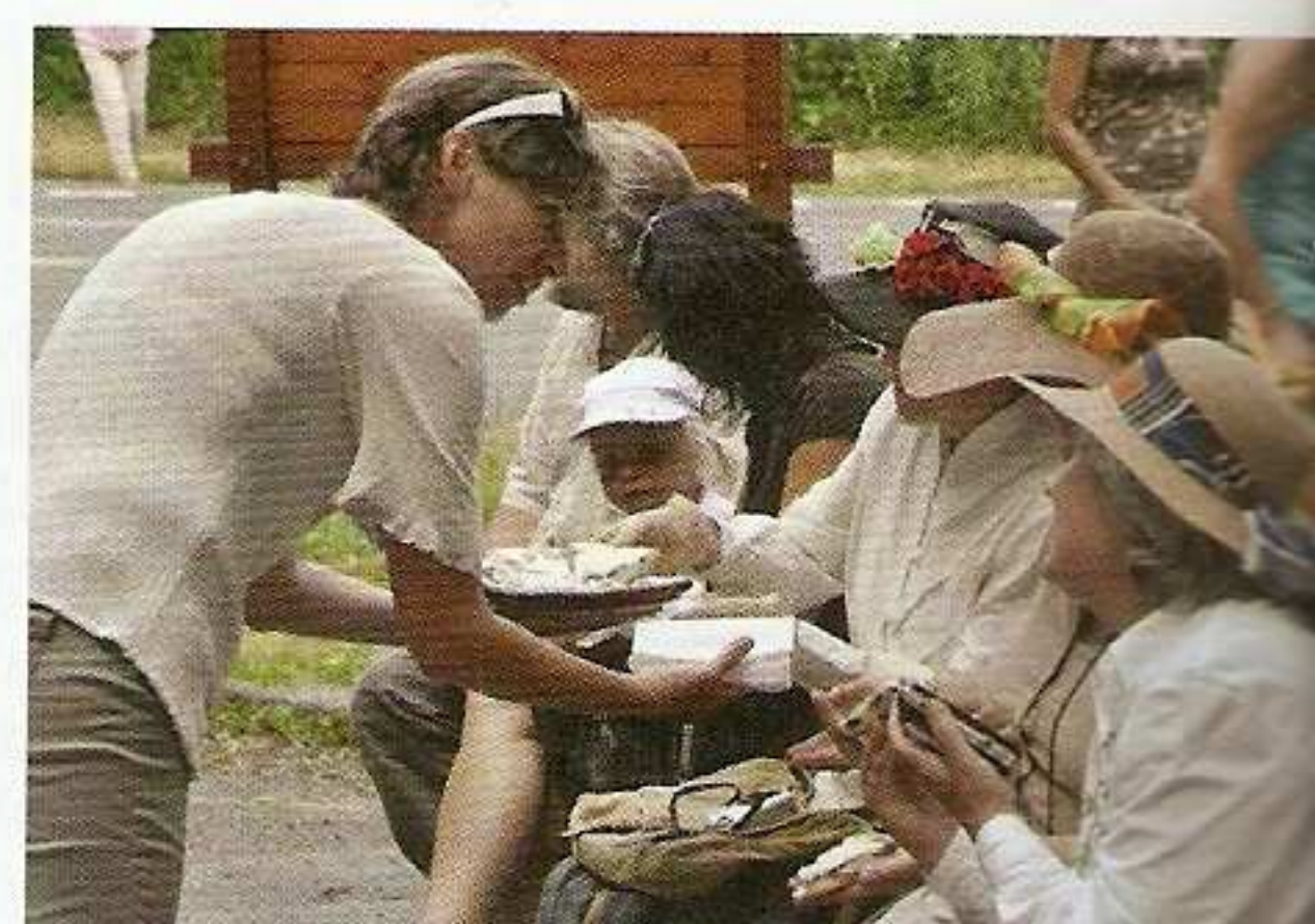
Kdo byl v dobovém kroji, dostal...