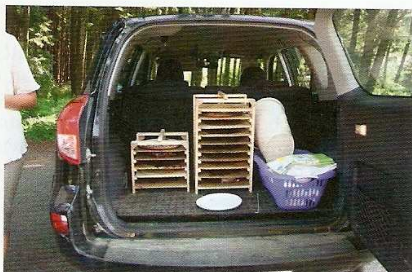
Pak přijela Toyota Land Cruiser speciálně upravená na převoz chodských koláčů.