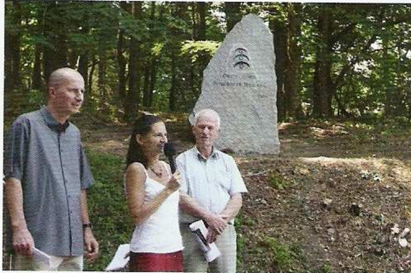
aby odhalili znovu vytvořený žulový obelisk na místě, kde stával původní.