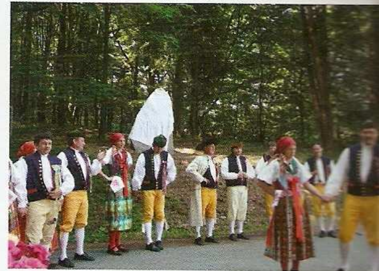
Žádná pořádná sláva se na Chodsku neobejde bez z...