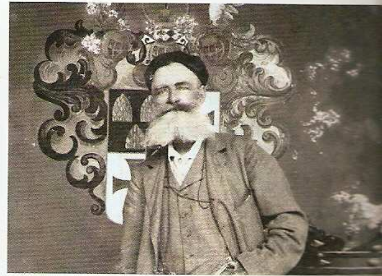
jeho Osvícenost říšský hrabě Jiří ze Stadionů.