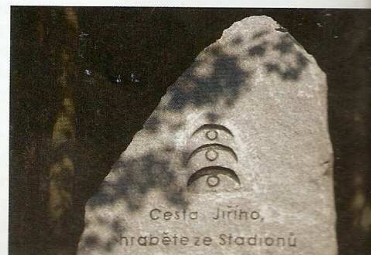
Chyběl jen děkovný obelisk na paměť štědrého našeho turistiky.