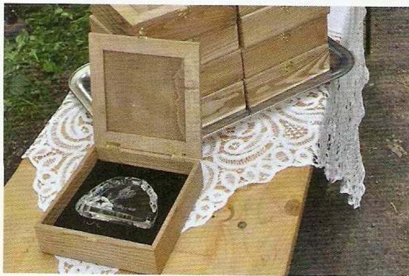
Byly předány děkovné plakety s krásným textem „S díky v úctě přátelé Českého lesa“