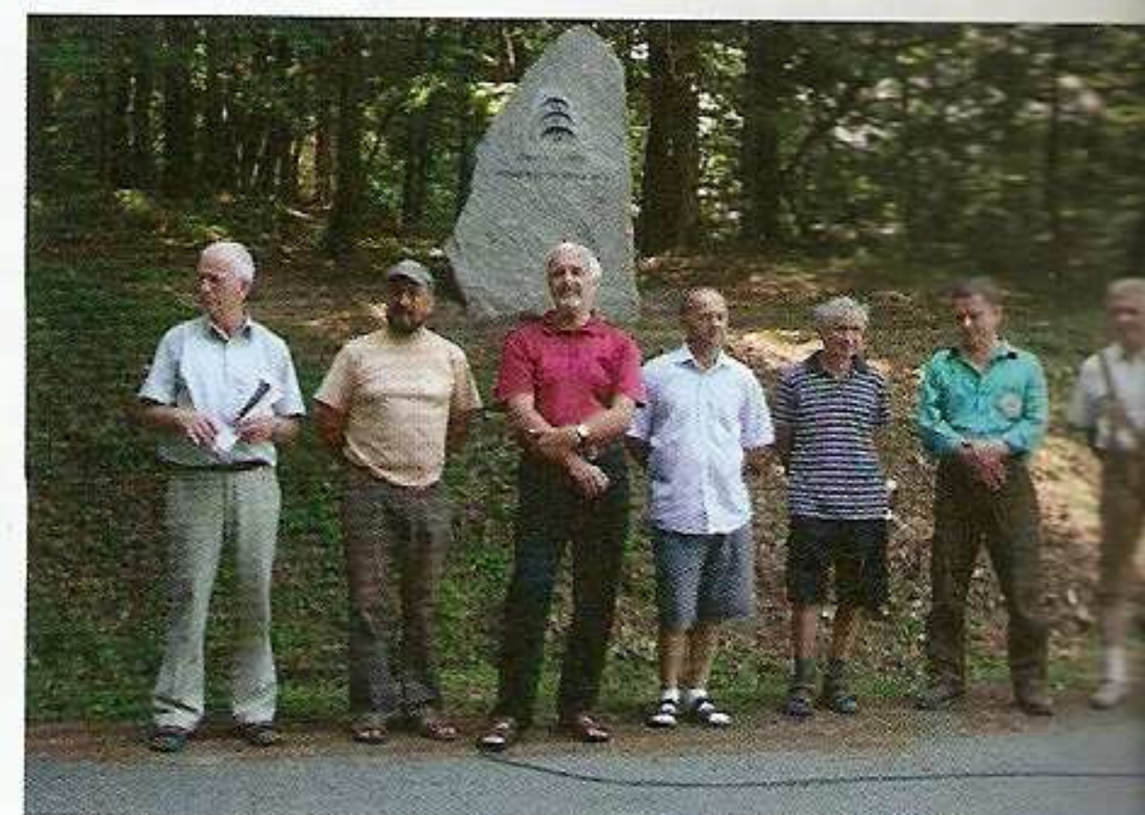
vybraným dobrodincům pracujícím pro příjemný v okolí Čerchova.