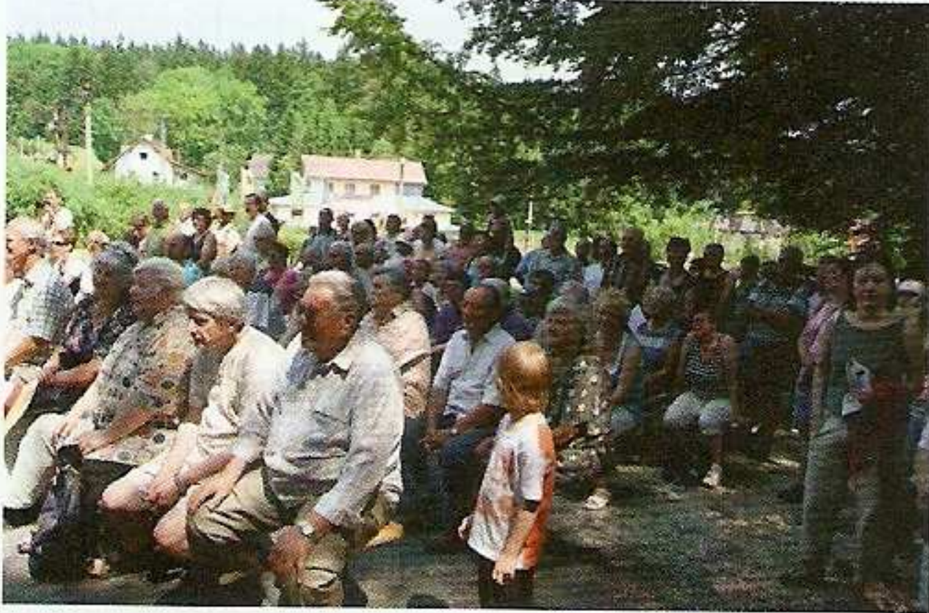
28. června 2010, o sto pět let později, se sešli přátelé a milovníci Českého lesa,